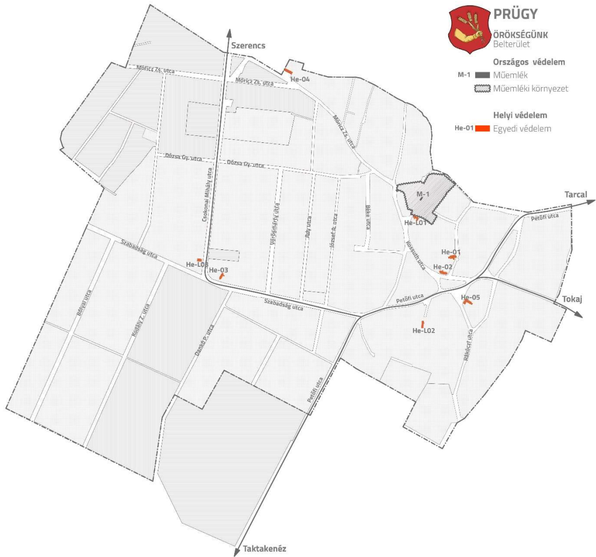
1. ábra: Országos és helyi védelmeket bemutató térkép