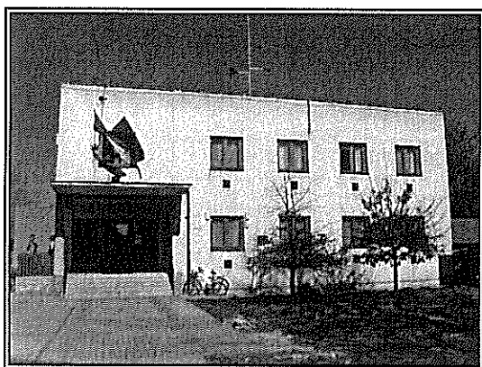
A Polgármesteri Hivatal épülete