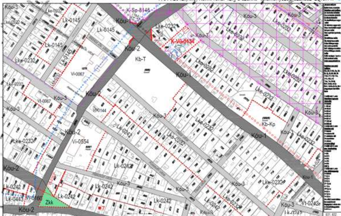
KÉSZÜLT AZ ÁLLAMI ALAPADATOK FELHASZNÁLÁSÁVAL HELYSZINI KIEGÉSZÍTÉSSEL Alaptérkép szerződés száma: NKP 10431-0309