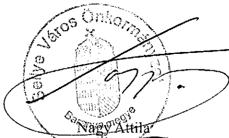
Sellye város polgármestere