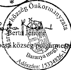
Marócsa község polgármestere