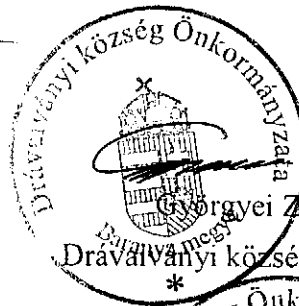
Drávaványi község polgármestere