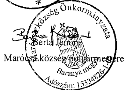
Marócsa község polgármestere