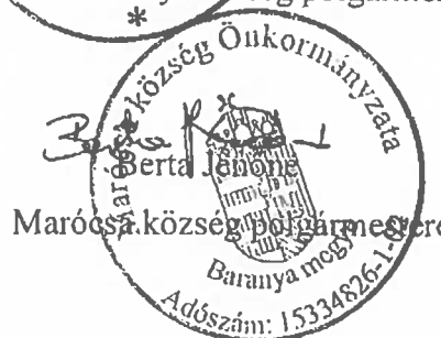
Marócsa község polgármestere