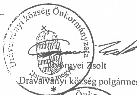
Drávaványi község polgármestere