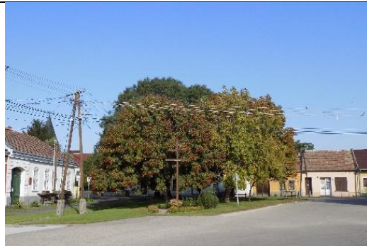
Közpark Újhelyi tér (hrsz.5/8.)