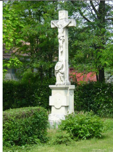
Kőkereszt a Vasút utcában (hrsz.594.)