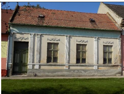
Lakóház (Fő u. 48. hrsz.36.)