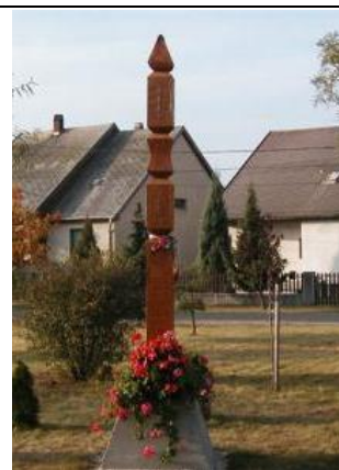
Kopjafa az 1848-es forradalom és szabadságharc emlékére (Május 1. liget melletti téren)