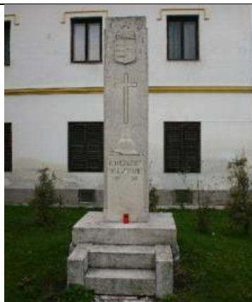
Első világháborús emlékoszlop a rk. parókia udvarán (Újhelyi tér hrsz.:66.)