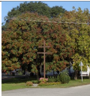
Millenniumi fakereszt az Újhelyi téren (hrsz. 5/8.)