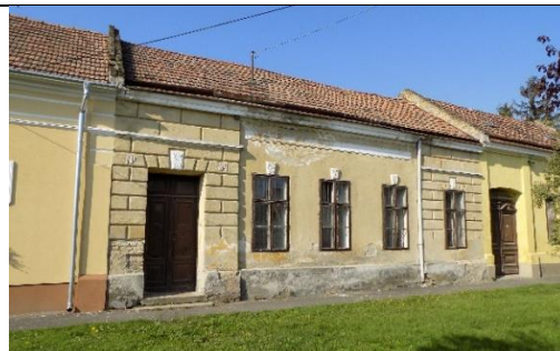
Lakóház (Fő u. 40. hrsz. 39.)