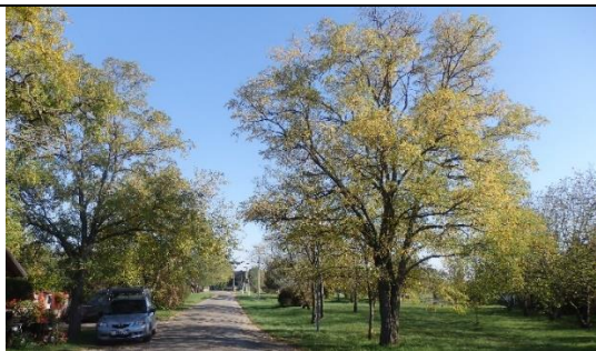
Vasút és József A. u. összeköttetése menti fasor (hrsz. 601. út)