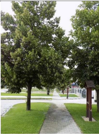
Temető előtti gyalogút, stációk melletti fasor (hrsz. 518/48.)