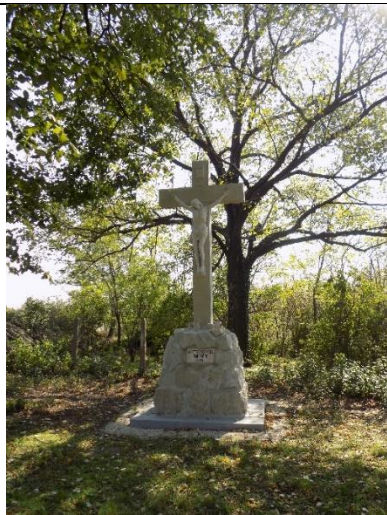
Kőkereszt a József Attila utcában (hrsz.525/43)