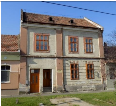
Lakóház (Fő u. 16 hrsz.51.)