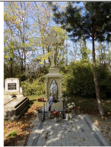
Kőkereszt a temetőben (hrsz.610.)