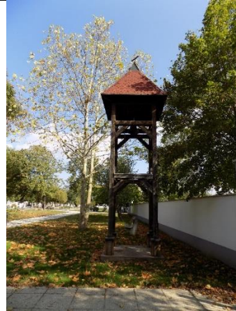
Harangláb a temetőben (hrsz.610.)