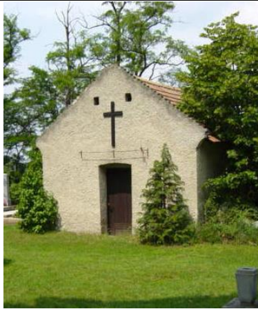
Régi ravatalozó a temetőben (hrsz.610.)