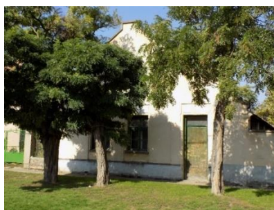
Lakóház (Tó u. 20. hrsz.527.)