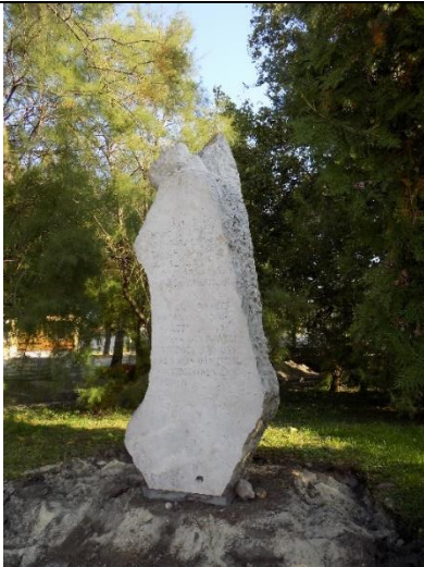
Második világháborús emlékmű az Újhelyi téren (hrsz.5/8.)