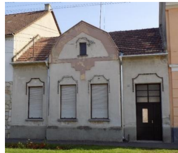
Lakóház (Fő u. 25. hrsz 226.)