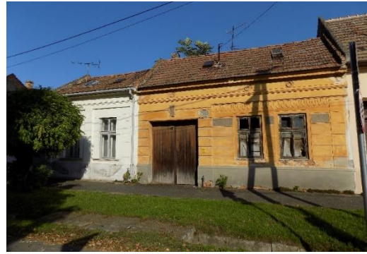
Lakóházak (Újhelyi tér 7-8-9. hrsz. 68.,71.,72.)