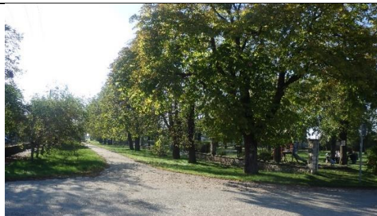
Vasút utca park melletti folytatásában található fasor (hrsz 604. út)