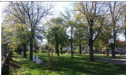
Közpark (hrsz. 605.)