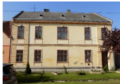
Evangélikus parókia (Fő u. 32. hrsz.42.)