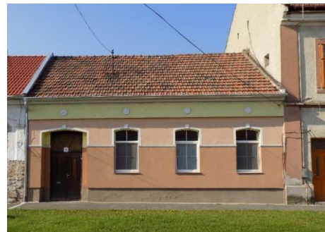
Lakóház (Fő u. 18 hrsz.50.)