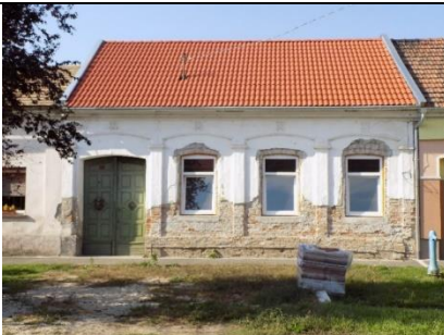
Lakóház (Fő utca 20. hrsz.: 49.)