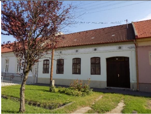
Lakóház (Fő u. 17. hrsz.220/1.)