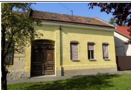
Lakóház (Fő u. 38. hrsz. 40.)