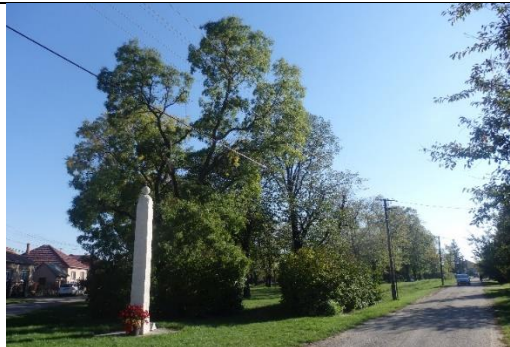
Május 1.utcai fasor (hrsz.518/4.)