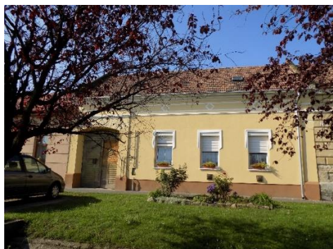
Lakóház (Fő u. 42. hrsz.: 38.)