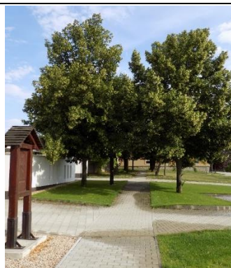
Fából készült stációk az Ág utca északi végén, a temetőhöz vezető gyalogút mentén (hrsz. 518/48.)