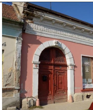
Lakóház (Fő u. 46. hrsz.35.)