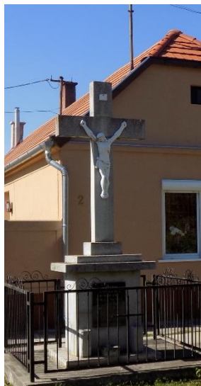
Árpád u. 2. szelőtt