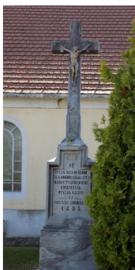
korpusszal a templom mellett hrsz.: 288.