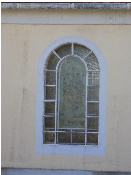
Piéta szobor Fő u. 123-125 házszám között hrsz.: 310.