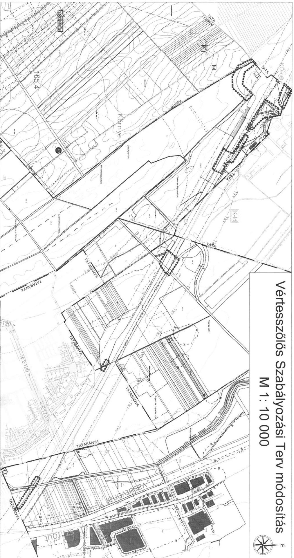
1. melléklet a 23/2021. (XI.12.) önkormányzati rendelethez "Készült az állami alapadatok felhasználásával."