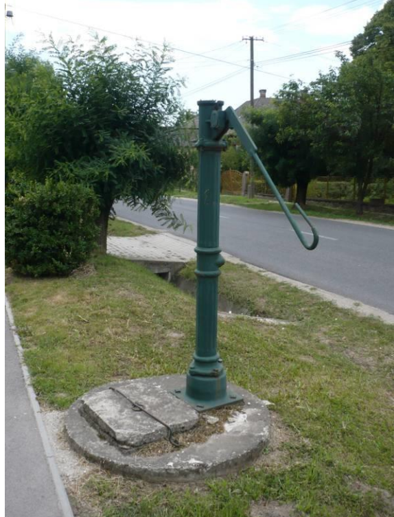
B-26 Kereszt Dózsa Gy. u. vége, Hrsz. 052/4

B-24. Öntöttvas közkút, Kossuth L. u. 41 előtt, hrsz. 547 Hiányzik a kifolyócső, helyreállítható.