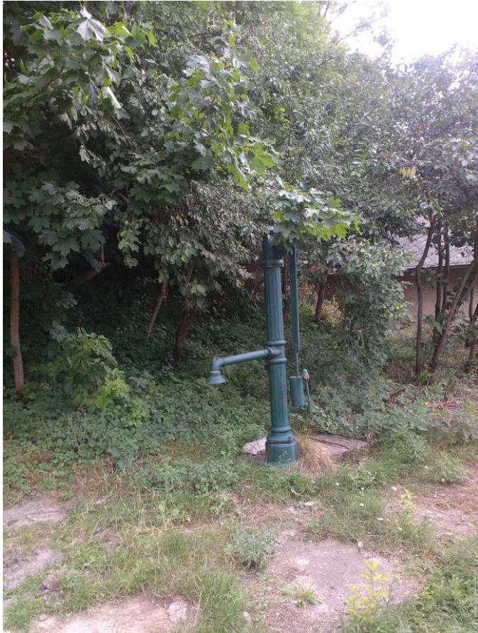
B-22. Falumúzeum, Kossuth L. u. 33. Hrsz. 423

Oldalhatáron álló, tornác nélküli lakóház, fa oromfallal. A falu legépebben megmaradt régi parasztháza. Felújított; jelenleg tájház, helytörténeti gyűjteménnyel