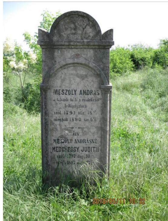
B-13 Katolikus temető, Dózsa György utca, Hrsz. 321 Védelem alatt állnak az alábbi XIX. sz.-i sírkövek.