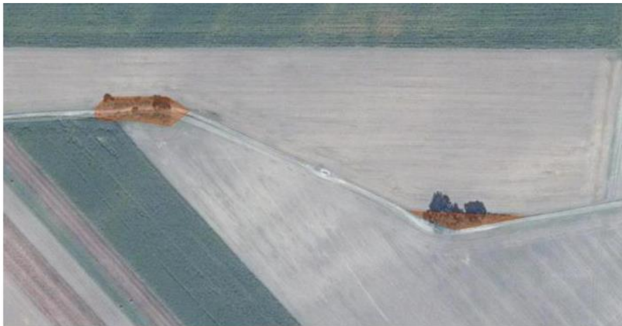
1-es (balra) és 2-es (jobbra) terület

A fehér nyár 3 méter feletti törzskerületűek. A fehér nyár szomszédságában található rezgő nyár egy hangyakolóniának is otthont ad, amely ex-lege védett, valamint a törzsből található nagy méretű odú denevéreknek is otthont adhat. A két facsoport meghatározza a község keleti területeinek látképét. A lakosok kötődése a két facsoporthoz jelentős, ezt bizonyítja, hogy számos fotón megjelentek már az említett példányok.