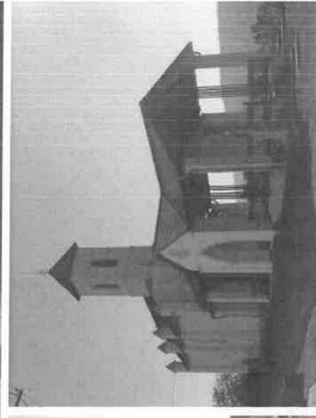
Görögkatolikus kápolna A görögkatolikus templomkertben