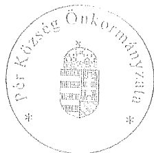
Rákli Lászlóné aljegyző