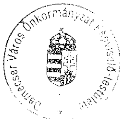
Váradi László polgármester

Határidő: Azonnal. Felelős: Polgármester