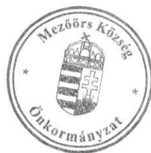
Rákli Lászlóné aljegyző