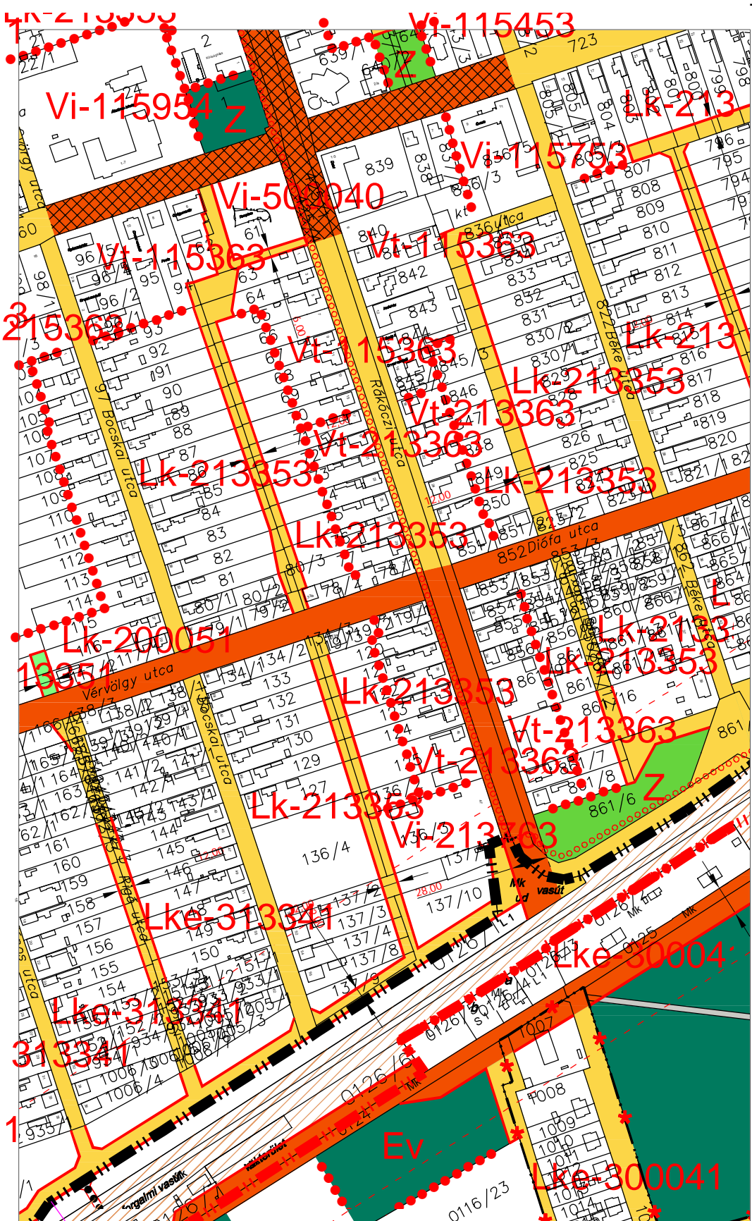
VONALAS SZABÁLYOZÁSI ELEMÉK