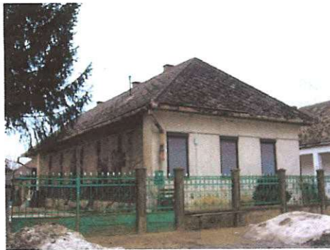
lakóház Dózsa György utca 85. 239. hrsz.