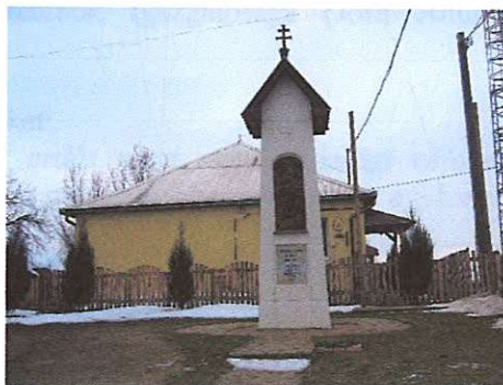
Emlékmű Dózsa György utca 208. hrszt.