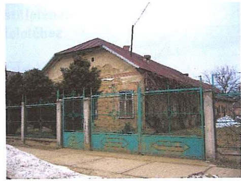
lakóház Dózsa György utca 64. 378. hrsz.