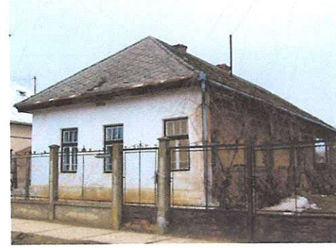
lakóház Dózsa György utca 72. 373. hrsz.