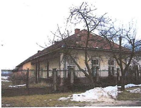
lakóház Dózsa György utca 75. 234. hrsz.