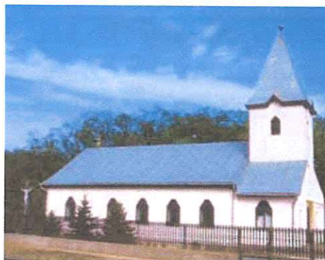
Görög Katolikus templom Jókai utca 364/2. hrszt.