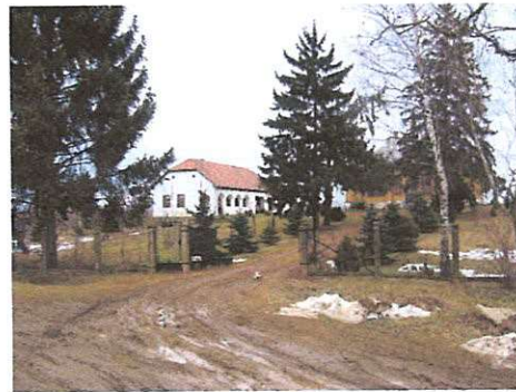
lakóház Endes út 3. 470. hrsz.