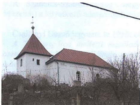
Református templom Kossuth L. utca 409/1. hrszt.