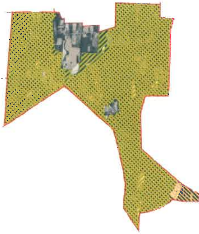
Natura 2000 területek