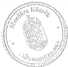
Rákli Lászlóné aljegyző