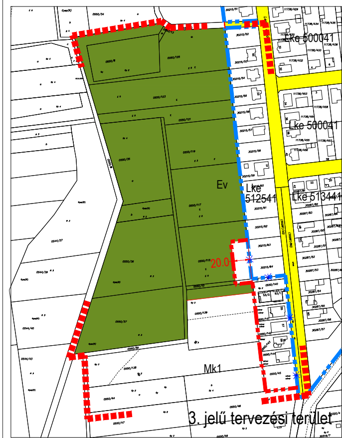
3. jelű tervezési terület