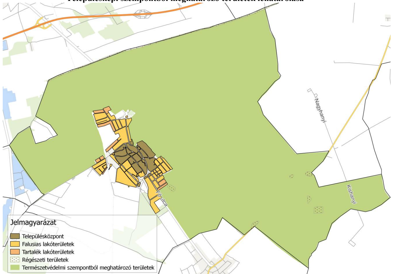
1. ábra: Településképi szempontból meghatározó területek a település közigazgatási területén