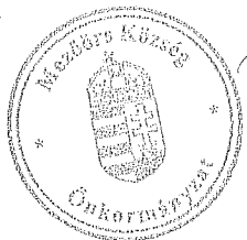
Rákli Lászlóné aljegyző