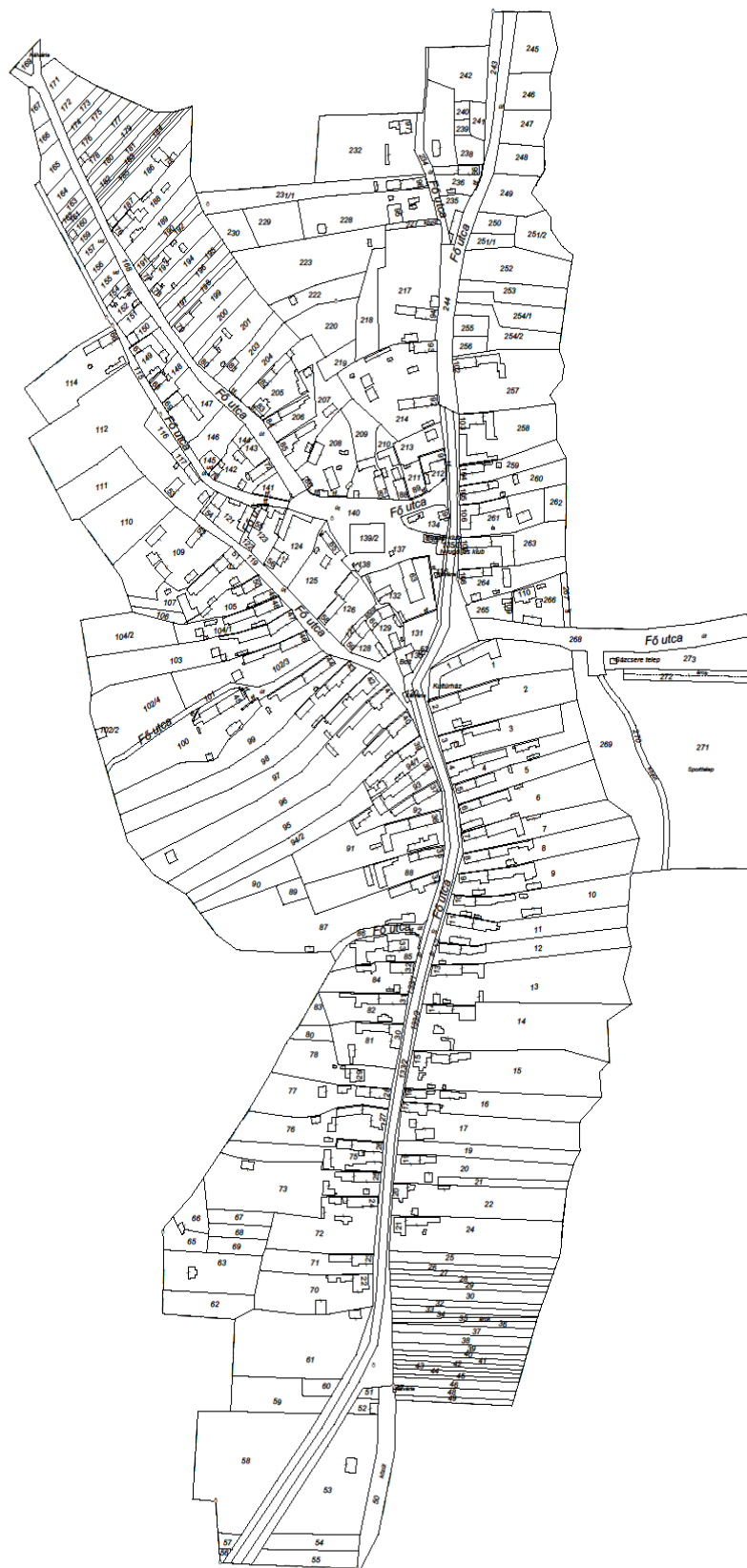
Kékesd belterületi térképázata