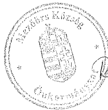
Rákli Lászlóné aljegyző