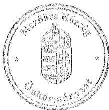
Rákli Lászlóné aljegyző