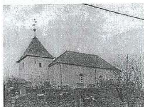
Református templom Kossuth L. utca 409/1. hrsz.