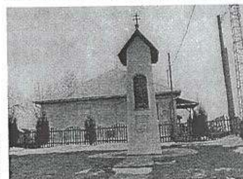
Emlékmű Dózsa György utca 208. hrsz.