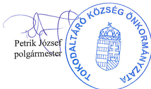
Petrik József polgármester

15. § E rendelet a kihirdetést követő napon lép hatályba.