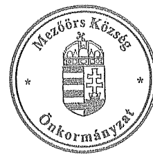
Rákli Lászlóné aljegyző