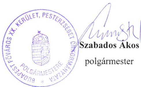
Szabados Akos polgármester

E rendelet a kihirdetést követő napon lép hatályba.