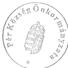
Rákli Lászlóné aljegyző

A rendelet kihirdetése megtörtént: 2016. április 28.