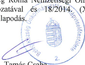
Tamás Csaba polgármester

Jelen együttműködési megállapodás elfogadásával hatályát veszti a Beleg Község Önkormányzata Képviselő-testülete által a 7/2014. (IV.10.) önkormányzati rendelet 5. melléklete, továbbá a Beleg Község Önkormányzatának Képviselő-testülete 83/2014. (X. 21.) önkormányzati határozatával elfogadott együttműködési megállapodás, valamint a Beleg Község Roma Nemzetiségi Önkormányzatának Képviselő-testülete 6/2014. (IV.30.) számú határozatával és 18/2014. (X. 21.) számú határozatával elfogadott együttműködési megállapodás.